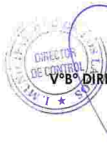
V°B° DIRECCIÓN DE CONTROL