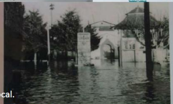
Municipalidad Inundada por el Riñihuezo 1960