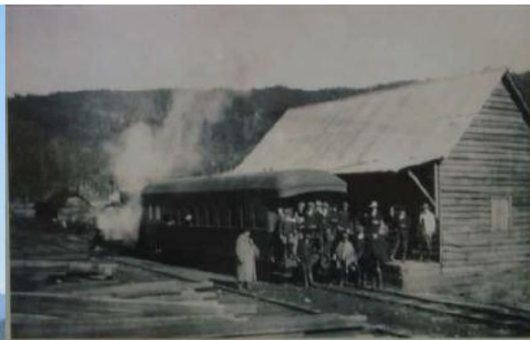
Bienvenida al Ferrocarril Trasandino Década 1910