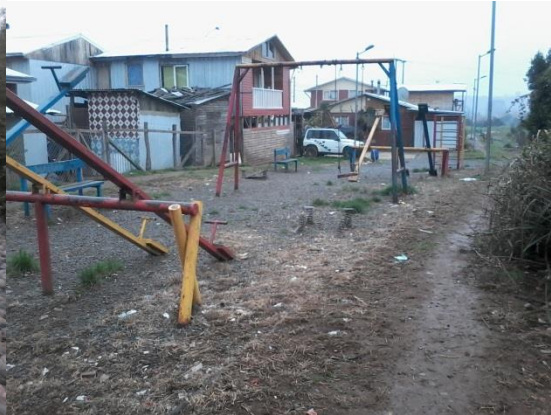
VILLA FE Y ESPERANZA