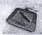
Pad de firma