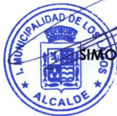
SIMÓN MANSILLA ROA