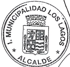
SAMUEL TORRES SEPÚLVEDA ALCALDE I. MUNICIPALIDAD DE LOS LAGOS