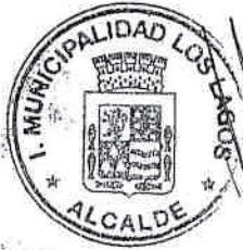
SAMUEL TORRES SEPULVEDA ALCALDE I.MUNICIPALIDAD DE LOS LAGOS