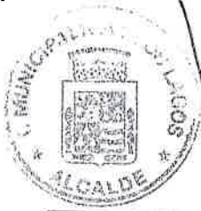
SAMUEL TORRES SEPULVEDA ALCALDE I. MUNICIPALIDAD DE LOS LAGOS