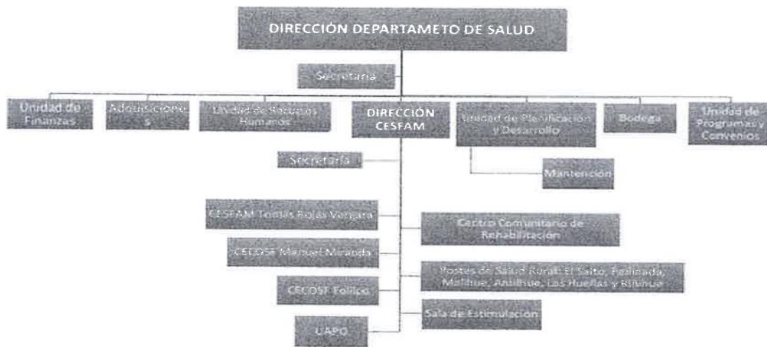
ORGANIGRAMA SALUD MUNICIPAL LOS LAGOS

Se adjunta además, el Organigrama del Departamento de Salud Municipal, en el cual se definen las unidades de trabajo en donde se desempeñan los funcionarios que se presentan en la dotación anteriormente expuesta, incluyendo el nuevo CECOSF Folilcc y la Unidad de Atención Primaria de Oftalmología (UAPO) en implementación y marcha blanca durante el último trimestre del 2016: