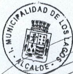
SIMON MANSILLA ROA ALCALDE I.MUNICIPALIDAD DE LOS LAGOS